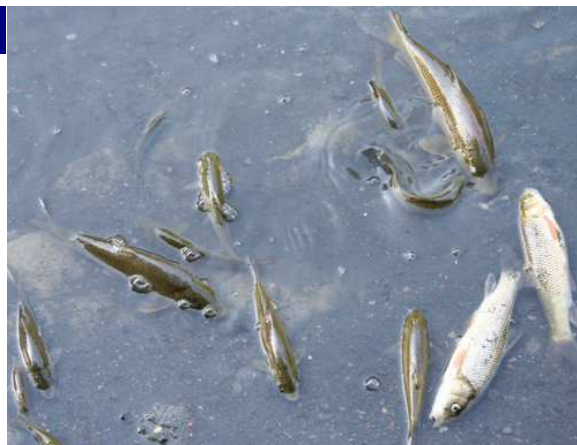
Todos los años mueren miles de peces en los ríos de Navarra ante la desidia de los responsables de Medio Ambiente.

Por enésima vez se ha producido un vertido de purines en el río Ulzama, acabando con todos los peces de tamaño mediano y grande en el tramo que discurre por este valle. La diferencia de este vertido con los centenares anteriores es que éste último se ha producido en una empresa de biogás, ubicada en Iraizotz, y que en teoría se puso en marcha precisamente para evitar el vertido de purines al río. Esta empresa está funcionando de forma ilegal, con el apoyo del Departamento de Medio Ambiente, ya que no dispone de los imprescindibles tanques de retención, necesarios para estos casos. Gurelur va a presentar una denuncia ante el Director General de Medio Ambiente por esta ilegalidad. Como sabemos que no nos va a contestar, trasladaremos esta nueva ilegalidad al Defensor del Pueblo.