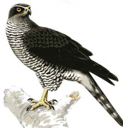
El azor es una de las especies que más sufre la estupidez de los autodenominados cetreros. Es junto con el halcón peregrino la especie más expoliada por estos iluminados foráneos.

Gurelur ha presentado una queja ante el Defensor del Pueblo de Navarra por la utilización de aves rapaces en el centro comercial Itaroa. Primero presentamos una denuncia ante el Ayuntamiento de Huarte, que según la Ley debe autorizar el citado acto. Dado que se han lavado las manos, o sea que no han actuado conforme les obliga la Ley, Gurelur les ha incluido en la queja presentada ante el Defensor. Por desgracia, y debido a la falta de cultura y de ética de los organizadores de todo tipo de actos, la presencia de rapaces en ellos es cada vez mayor. Siguiendo con una lucha que empezamos hace más de 20 años, vamos a denunciar este tipo de actos, siempre que podamos, para ver si podemos conseguir que estos indeseables dejen de martirizar a las rapaces también en público.